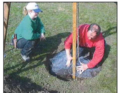
Abbildung 1: Einrichten eines Mäuseschutzes

Für Hochstämme ist eine Pflanzgrube von einem Meter und zirka vierzig Zentimeter Tiefe nötig. Die Grasnarbe wird sorgfältig entfernt, Oberboden und Unterboden werden getrennt ausgehoben. Dann wird der Baumpfahl eingeschlagen. Das Mäusegitter muss den Wurzelballen komplett schützen und wird bis zum Stamm und Pfahl gedrückt, damit die Mäuse nicht von oben eindringen können. Verzinktes Maschengitter hat sich nach rund fünf Jahren zersetzt. Bei der Entwicklung der Wurzeln konnten bisher keine Beeinträchtigungen festgestellt werden.