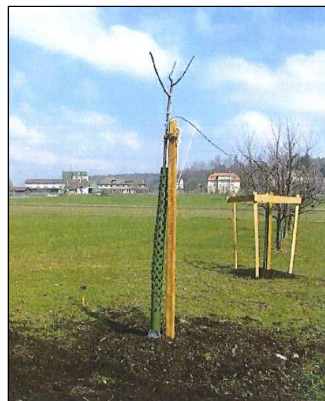
Abbildung 2: Krone Jungbaum und Stammschutz, im Hintergrund Viehschutz

Damit das Gras dem Baum nicht das Wasser und die Nährstoffe streitig macht, muss in den ersten Jahren im Sommer der Grasbewuchs um den Stamm entfernt werden. Dadurch werden auch die Pflegearbeiten (Mulchen und Mähen) stark erleichtert. Gleichzeitig sind unkrautfreie Baumscheiben und -streifen eine wirksame Massnahme zur Verhinderung von Mäuseschäden. Eine Kompostgabe auf die Baumscheibe ist eine geeignete Düngungsform für Jungbäume. Bei Hochstämmen ist der Einsatz von Herbiziden für eine Baumscheibe nach ÖLN Richtlinien nur die ersten fünf Jahre erlaubt. Danach ist ein Abdecken mit organischem Material oder regelmässiges Hacken sinnvoll.