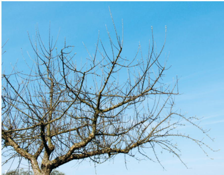
7 Die Astrangordnung an den Leitästen wird nicht aufrechterhalten. Es entstehen konkurrierende Leitastverlängerungen.

Da wir es auf den Streuobstwiesen häufig mit sehr vernachlässigten Bäumen zu tun haben, werden im Folgenden Maßnahmen und Schnittmethoden des Erneuerungsschnitts behandelt. Deren Pflege ist fachlich auch anspruchsvoller.