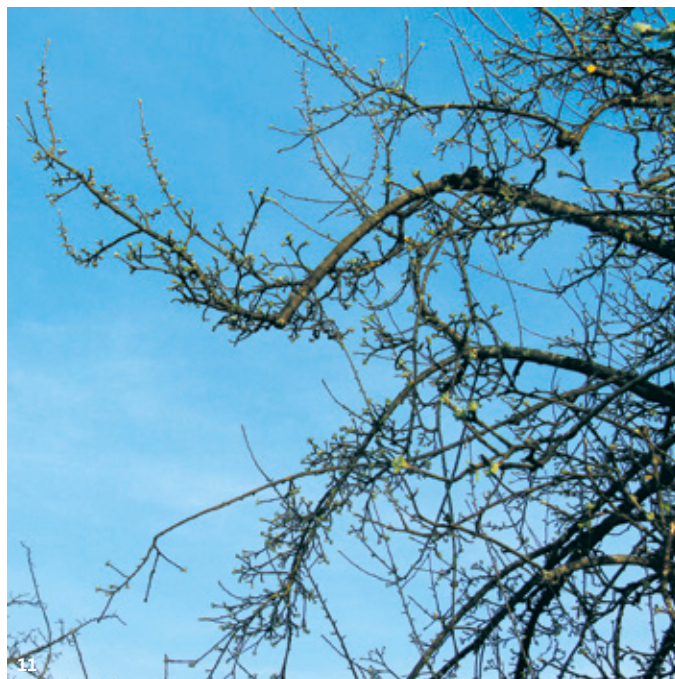
10 11 Fruchtholzverjüngung – Schnitt im Feinstbereich