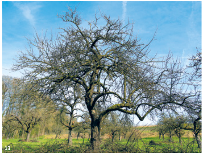
12 13 Kronenauslichtung an 'Aargauer Jubiläums- apfel' – vor und nach dem Schnitt